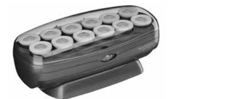
BABNTCHV15 - 12 Rulos 12 muy anchos (38 mm)