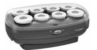
BABNTHS8 - 8 Rollers 4 Jumbo X (1-3/4"), 4 Jumbo XL (2")