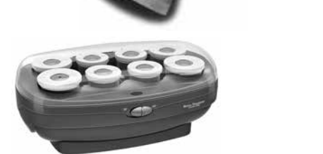
BABNTHS8 - 8 Rulos 4 muy anchos X (44 mm), 4 muy anchos XL (51 mm)