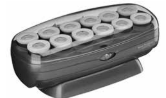
BABNTCHV15 - 12 Rollers 12 Jumbo (1-1/2")