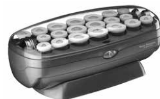
BABNTCHV21 - 20 Rollers 8 Large (1-1/4"), 6 Medium (1"), 6 Small (3/4")