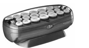
BABNTCHV21 - 20 Rulos 8 grandes (32 mm), 6 medianos (25 mm), 6 pequeños (19 mm)